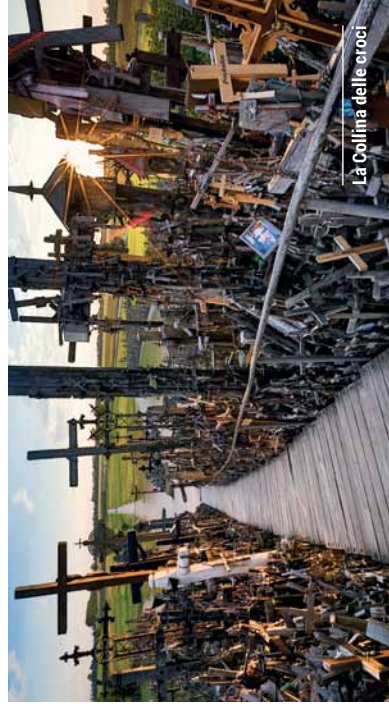
La Collina delle croci