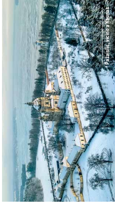
Pažaislis, vicino a Kaunas

Le strade di campagna, di solito sono del tutto deserte. Fermate la macchina, scendete, cominciate a respirare e riempitevi i polmoni di spazio. Questa è una sensazione che non dimenticherete così facilmente.